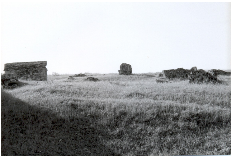
ΝΕΑ ΕΓΚΑΘΙΔΡΥΞΗ ΤΗΣ ΑΠΩΛΕΙΑΣ

Η αναπαράσταση της βλάστησης των ερειπίων από τη γη[8] οργανώνει θεματικά και την παρούσα αναπαράσταση του αττικού τοπίου. Ωστόσο (δεδομένων των αλλαγών που συντελέστηκαν στον τόπο) λαμβάνεται υπόψη κάποια νέα ιδιαιτερότητα της απόστασης από τα θαμμένα ερείπια. Η κτισμένη κουβέρτα της αττικής (στην οποία αναφερόμαστε σε αναλογία με τον αποκρύπτοντα γήινο φλοιό του Γονατά) δεχόμαστε ότι ακυρώνει την δυνατότητα του πετρώματος να διαβαστεί ως επιστύλιο. Η μανία της αποκάλυψης του γήινου βάθους χάνει έτσι σήμερα τα ερείσματά της. Σε μεγάλο βαθμό οι αναφορές στο βάθος σβήστηκαν. Λιγόστεψαν οι αναφορές στα ερείπια και στο φυσικό στοιχείο λιγόστεψαν τα εμφανή θραύσματα: το αττικό τοπίο (τεχνημένο πια σε μεγάλο βαθμό με πρόχειρες ασχεδίαστες κατασκευές) αποκρύπτει τις μουσικές του γραφές. Αν δεχθούμε ότι παλαιότερα η αττική γη ανελάμβανε την συμβολική υπενθύμιση του υποκειμένου ερειπιακού βάθους, (λειτουργώντας τότε ως μνήμη των θαμμένων ερειπίων) είναι δόκιμο να θεωρήσουμε ότι, σήμερα, οι εικόνες του κτισμένου τοπίου καταστρέφουν την αναφορά στο θαμμένο, παρουσιάζοντας ως θεματικό κέντρο του τοπίου την ανάσχεση της μνήμης ή την αμνησία προς το βάθος.